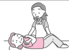
いふちやくだつ かいじよ たいい へんかん 衣服着脱の介助、体位変換